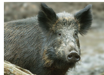
Das Wildschwein vom Seerücken - das Maskottchen des Forum B